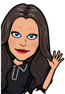
Binnenkomst @de Zwaantjes