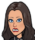
OH nee, allemaal korstjes