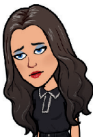
Oei, vind ze wel heel donker