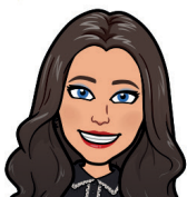
Yes, ben dol op mijn nieuwe wenkbrauwen!